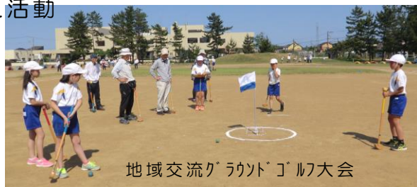
地域交流ゴルフ大会

災害ボランティア育成、環境美化活動、読み聞かせ・傾聴、食事サービス調理 防犯パトロール、施設等行事支援・交流、施設利用者介助 など