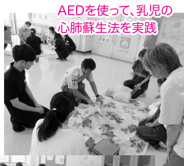
AEDを使って、乳児の心肺蘇生法を実践