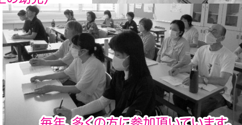
毎年、多くの方に参加頂いています。