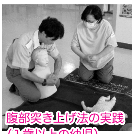
腹部突き上げ法の実践 (1歳以上の幼児)